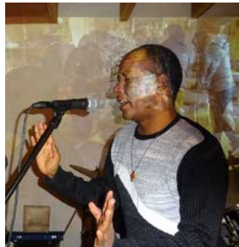
Weldihwet Mahari, auteur tigrinya